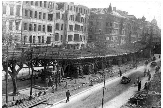
25.7.1944: Bombenschaden an der Hochbahnstrecke in Berlin-Schöneberg. Der Viadukt an der Bülowstraße erhielt am 19. Juli 1944 bei der Explosion einer Luftmine schwere Verwerfungen. Durch Holzstapel und Balken wird die Strecke provisorisch abgestützt.

beschreiben, die modernste und schönste Stadt Europas wurde in Schutt und Asche gelegt. Das erklärte Ziel sowohl von Bomber Harris, als auch unseres LeMay [US-General] war es, so viele Frauen und Kinder wie möglich zu töten. Das ist ihnen sehr gut gelungen; in ganz Europa haben sie eine riesige Ernte eingefahren. In den Geschichtsbüchern wird nicht erwähnt, wie viele Zivilisten in Frankreich, Holland, Dänemark, Norwegen, Belgien und so weiter getötet wurden. Es war schwer für mich, diese Männer in den Krankenhäusern und Lagern zu sehen; für mich waren sie Mörder von Unschuldigen. Aber ich musste sie in meiner Sendung interviewen und sie nach Hause grüßen lassen. Ich weiß, dass sie nur Befehle befolgt haben, aber ich habe trotzdem zuerst an all die Opfer gedacht. Unsere Jungs hätten nie in diese Situation gebracht werden dürfen. Sie haben ihre eigenen Leute getötet und haben das nicht verstanden.