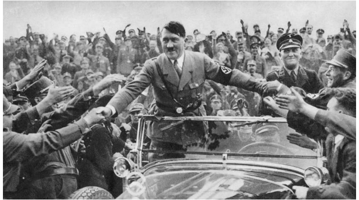
Adolf Hitler wird 1933 in Nürnberg von Anhängern begrüßt

Im Jahr 1934 sah ich überall Bauarbeiten, das ganze Land wurde neu aufgebaut. Als Amerikaner wurde ich mit offenen Armen empfangen, denn die Deutschen wollten den Ausländern zeigen, wie friedlich es im Gegensatz zu den weltweiten Presseberichten war. Die Juden wurden in Ruhe gelassen, die einzigen Betroffenen waren die Kriminellen. Diejenigen, die zu Unrecht belohnt wurden und Monopole, die durch jüdische Macht geschaffen wurden. Deutschland stand kurz vor einer kommunistischen Revolution, die von Juden angeführt wurde und Hitler verhinderte dies und bestrafte sie dafür. Wenn sie dem Staat gegenüber loyal waren, wurden sie in Ruhe gelassen und das waren die meisten.